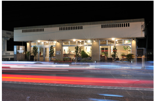
COTONOHA at Night