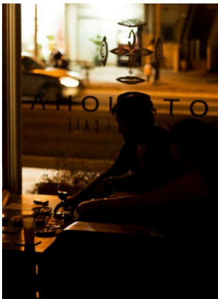
COTONOHA at Night